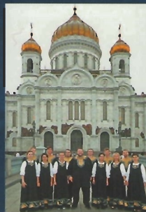
Камерный хор «ПОКРОВ» Il Coro da camera «POKROV»

ore 10.30 Portico dei Pellegrini della Basilica di San Nicola Inaugurazione della mostra di fotografie di Alexander Guscin “La Russia e i suoi molteplici volti”