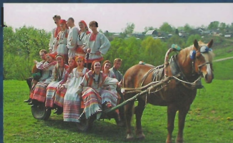
Фольклорный коллектив «УСЛАДА» Complesso folcloristico USLADA

MINISTERO DEGLI AFFARI ESTERI DELLA FEDERAZIONE RUSSA